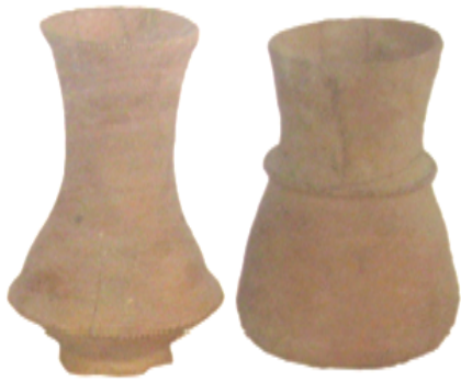
Hình 1.1. Bình hoa