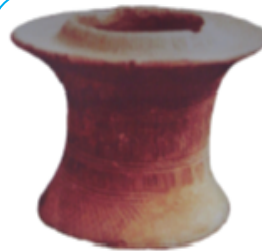
Hình 1.8. Đền gốm