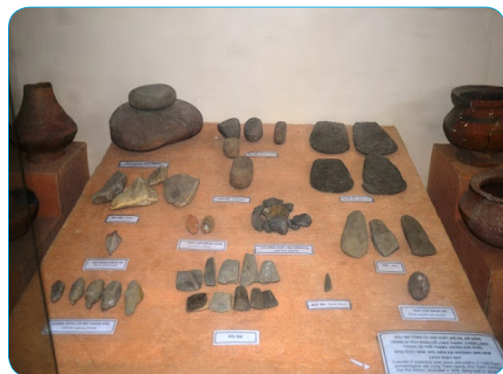
Hình 1.16. Công cụ sản xuất đồ đá trong di tích Long Thạnh (Đức Phổ)