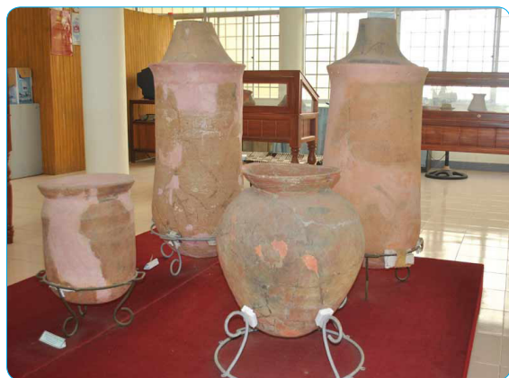
Hình 1.15. Mộ chum được trưng bày tại Nhà trưng bày văn hoá Sa Huỳnh