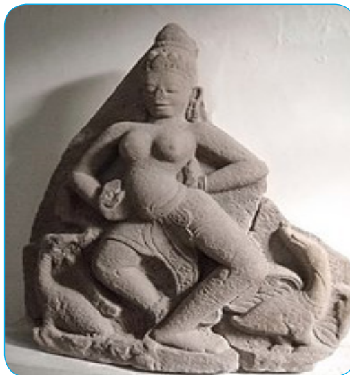
Hình 1.19. Phù điêu nữ thần Srasvati, phát hiện tại tháp Chánh Lộ hiện trưng bày tại bảo tàng Điêu khắc Chăm – Đà Nẵng