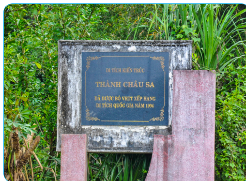
Hình 1.18. Di tích thành Châu Sa ở thành phố Quảng Ngãi

Niên đại xây dựng tháp Chánh Lộ được nhiều nhà nghiên cứu ước đoán vào khoảng thế kỉ X đầu thế kỉ XI, theo thời gian tháp bị huỷ hoại, đổ nát và đến nay đã hoàn toàn không còn dấu vết. Tên tháp gọi theo tên của làng Chánh Lộ thuộc phủ Tư Nghĩa, tỉnh Quảng Ngãi vào thời điểm cuối thế kỉ XIX đầu thế kỉ XX, nay là khu vực bệnh viện Sản – Nhi Quảng Ngãi, Phường Trần Phú, thành phố Quảng Ngãi.