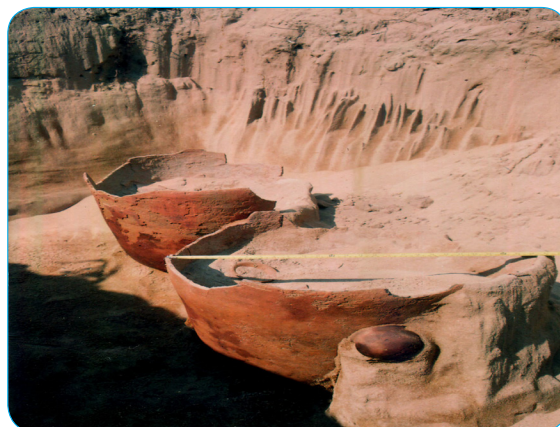
Hình 1.13. Mộ chum đặc trưng của văn hoá Sa Huỳnh

Qua các di chỉ khảo cổ học, các nhà nghiên cứu đã khẳng định đặc trưng của văn hoá Sa Huỳnh là hình thức chôn cất người chết trong chum, vò bằng gốm (mộ chum), kèm theo các đồ tùy táng. Qua các di vật sưu tầm được đã cho thấy những nét cơ bản trong đời sống vật chất và tinh thần của cư dân văn hoá Sa Huỳnh. Đó là nhóm người biết trồng trọt, đánh cá ven bờ biển, sử dụng vũ khí, công cụ lao động bằng đá (rìu, cuốc, bàn mài), xương động vật (mũi kim), bằng đồng thau (lao, mũi tên, lưới câu, dao găm, mũi giáo,...) và bước đầu biết đến đồ sắt. Ngoài ra, họ còn biết làm đồ gốm, thủy tinh, chế tạo đồ trang sức và sáng tạo nhiều dạng hoa văn độc đáo, đặc biệt là trên đồ gốm.