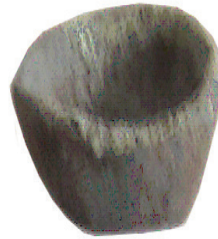
Hình 1.4. Muỗng rót đồng