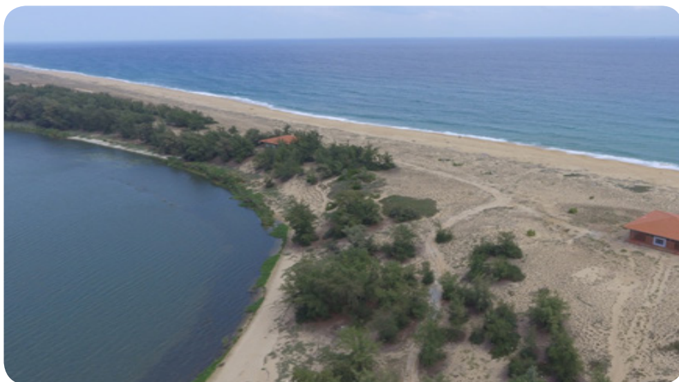
Hình 1.10. Một góc đầm An Khê (thị xã Đức Phổ), nơi đầu tiên phát hiện di chỉ văn hoá Sa Huỳnh

Văn hoá Sa Huỳnh là một trong ba nền văn hoá cổ đại trên lãnh thổ Việt Nam (văn hoá Đông Sơn, văn hoá Sa Huỳnh, văn hoá Óc Eo), có niên đại cách ngày nay trên 3 000 năm và được đặt theo tên di chỉ khảo cổ học Sa Huỳnh (thị xã Đức Phổ, tỉnh Quảng Ngãi) – nơi đầu tiên phát hiện các di vật của nền văn hoá này vào năm 1909.