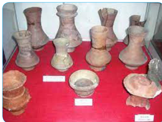
Hình 1.17. Đồ gốm thuộc văn hoá Sa Huỳnh được khai quật ở Long Thạnh (Đức Phổ)