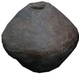
Hình 1.3. Dọi xe chỉ

(Thuộc di chỉ Long Thạnh, Đức Phổ khai quật năm 1978)