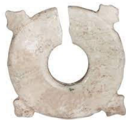
Hình 1.7. Khuyên tai bốn mấu bằng đá Nephrit