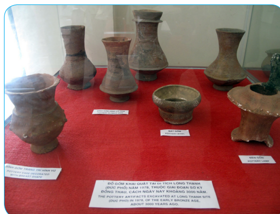
Hình 1.14. Đồ gốm khai quật năm 1978 tại di tích Long Thạnh (Đức Phổ)