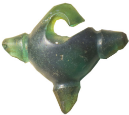
Hình 1.6. Khuyên tai ba mấu bằng thủy tinh

(Thuộc di chỉ Bình Châu, Bình Sơn khai quật năm 2002)