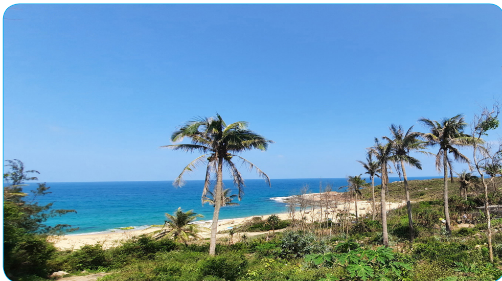
Hình 1.11. Làng cổ Gò Cỏ bên bờ biển Sa Huỳnh (phường Phổ Thạnh, thị xã Đức Phổ), nơi lưu giữ những dấu tích của văn hoá Sa Huỳnh