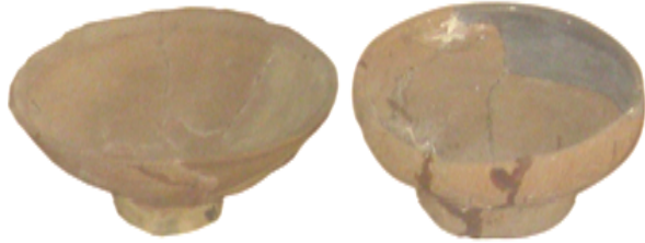
Hình 1.2. Bát gốm

(Thuộc di chỉ Long Thạnh, Đức Phổ khai quật năm 1978)