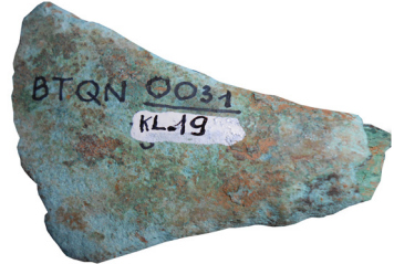
Hình 1.5. Rìu đồng

(Thuộc di chỉ Bình Châu, Bình Sơn khai quật năm 2002)